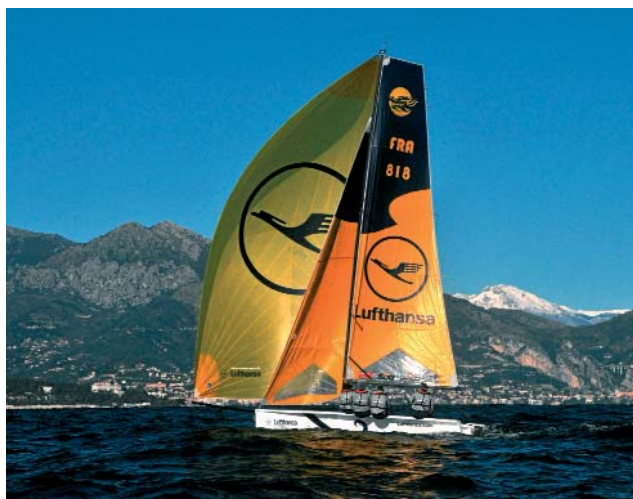
Die Longtze in Lufthansa-Farben vor der prachtvollen Kulisse Monacos