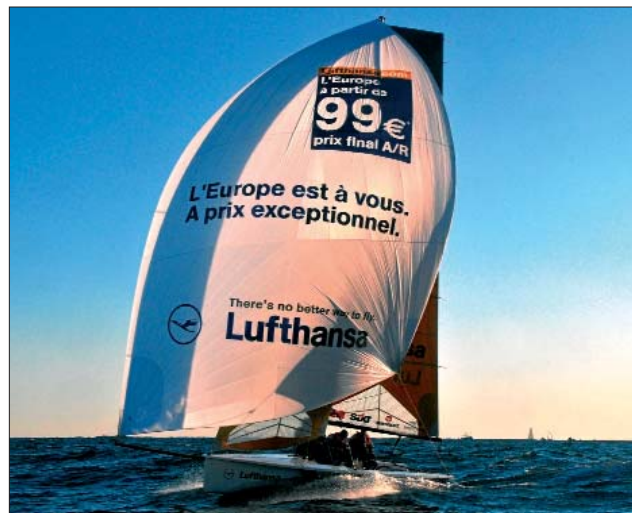
Lufthansa geht aufs Wasser - mit erfahrenerem Team und atemberaubendem Boot

«Sie ist ein sehr modernes Boot. Es steckt viel Carbon drin, was die Longtze leicht, aber widerstandsfähig macht. Auch, dass 40 Prozent ihres Gesamtgewichts